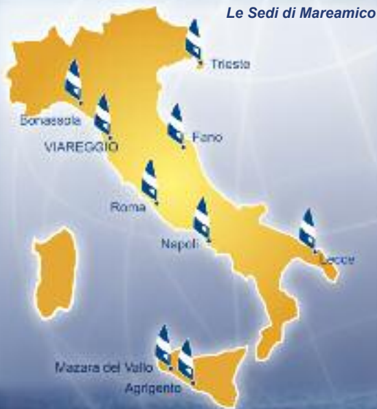
Le Sedi di Mareamico

55049 Viareggio (LU) - Via M. Bertini, 130 - Tel./Fax 0584.50511 - mareamico@mareamico.it - www.mareamico.it